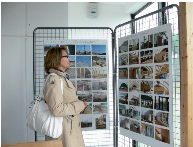
Panneau retraçant les différentes étapes de la construction du tennis.