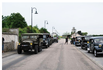
Une des tractions, le char et une jeep qui suivaient le cortège et qui ont parcouru tout le village pour commémorer la victoire des alliés.