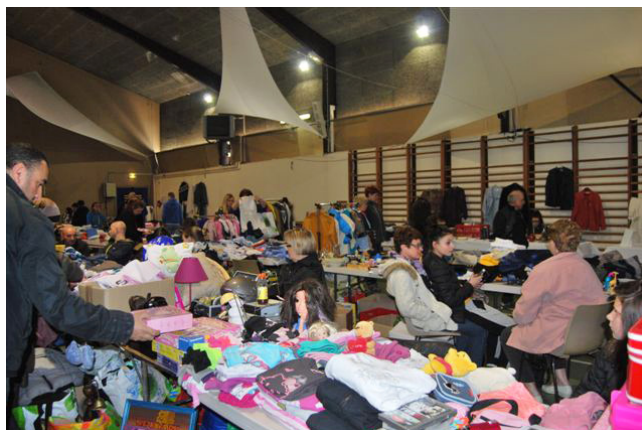
Le bric à brac.