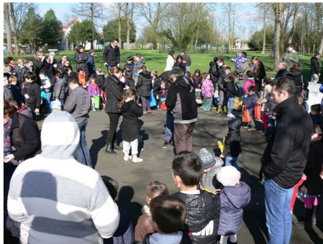
Sacs pleins : les cloches sont peut être passées aussi chez Mamie...