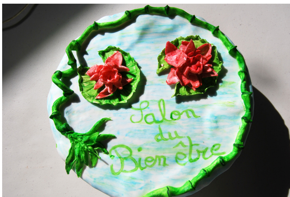
Gateau offert par la présidente de l'association du bien être et partagé avec les exposants à la fin du salon.