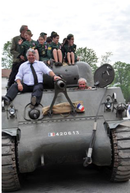
Le maire et les conseillers municipaux juniors ont parcouru les rues de Charny sur le char.