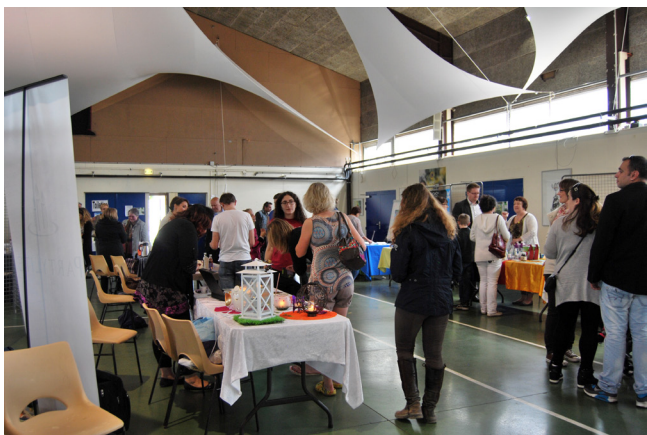
Salon du bien être.