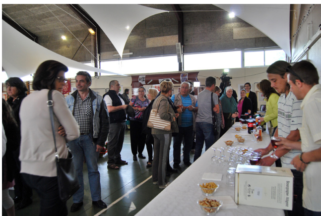
Pot de l'amitié.