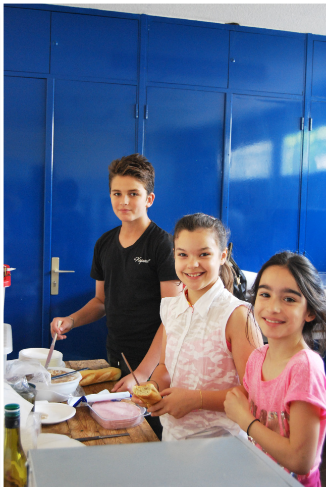
Les enfants de conseil distribuent les sandwiches.