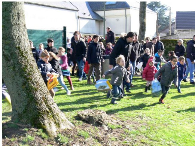
Ouverture de la chasse.