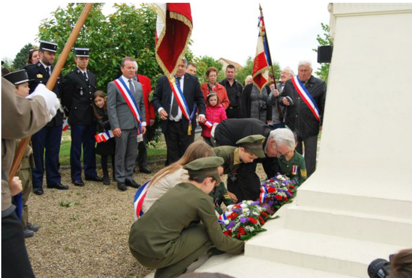
Dépôt des gerbes au monument aux morts.