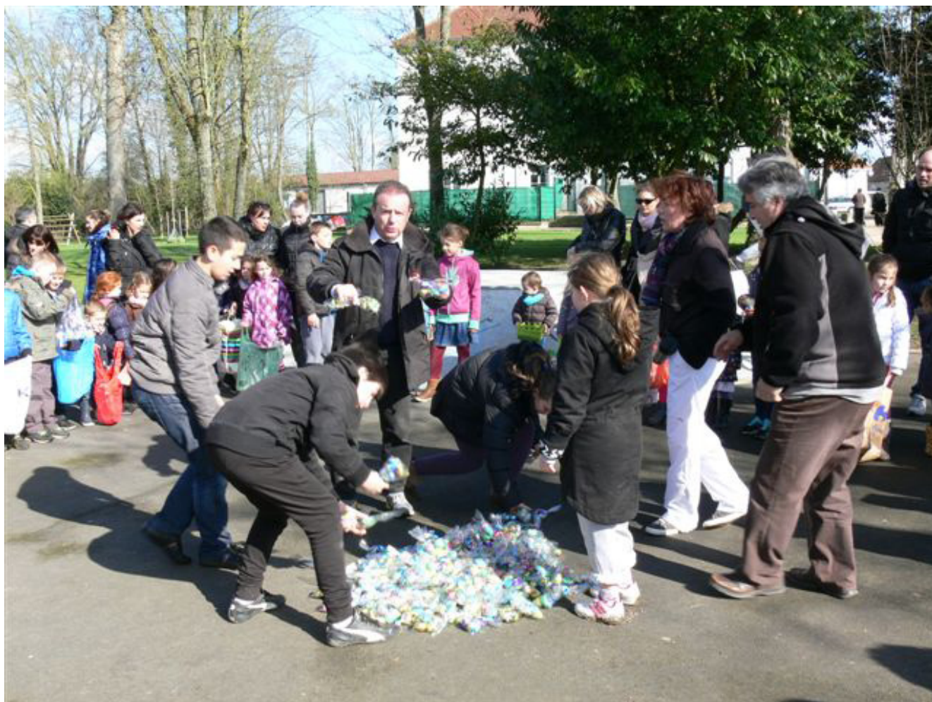
Partage du butin.