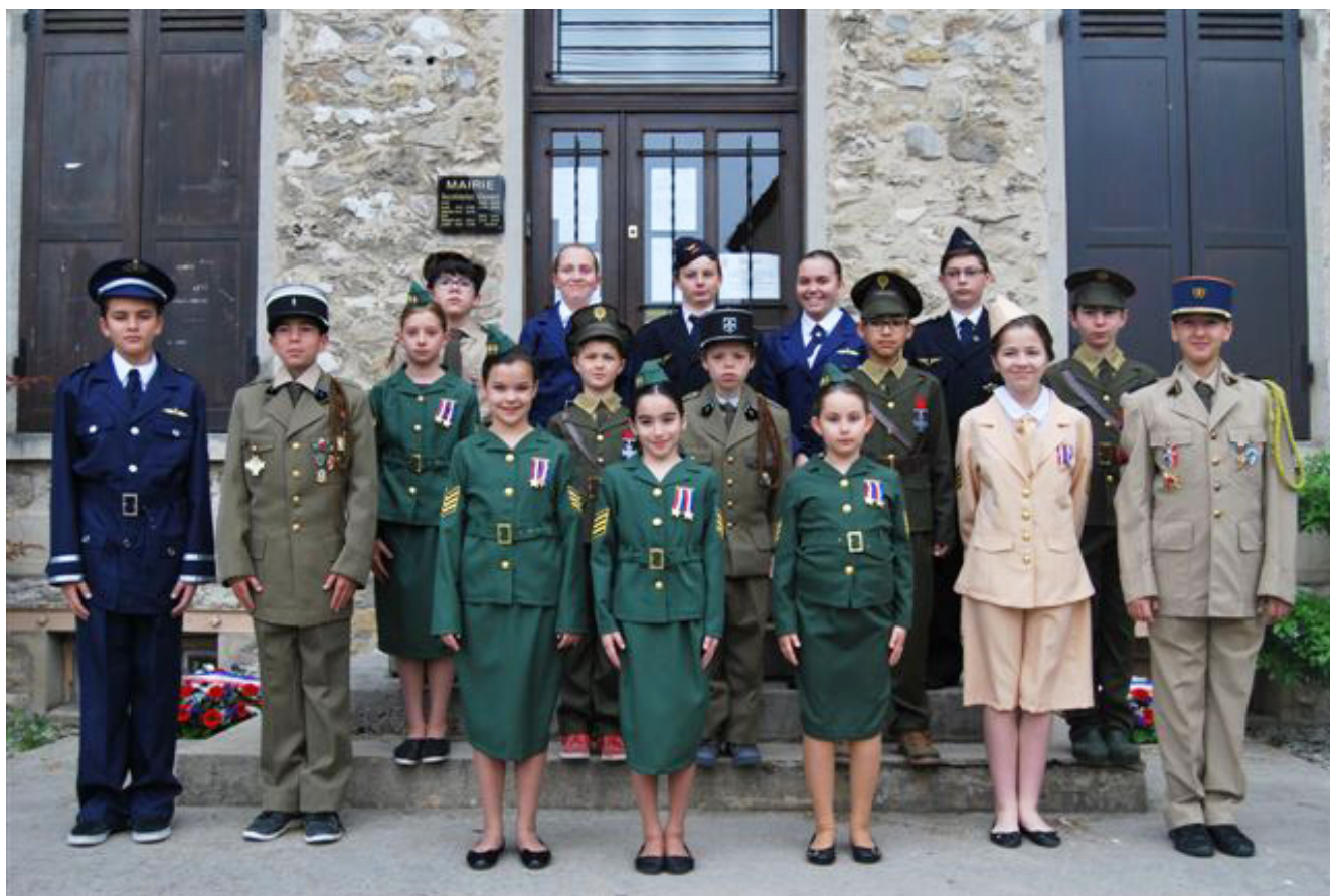
Les enfants élus au Conseil Municipal en costumes d'époque.

Cérémonie du 8 mai - 70 ème anniversaire de l'armistice.