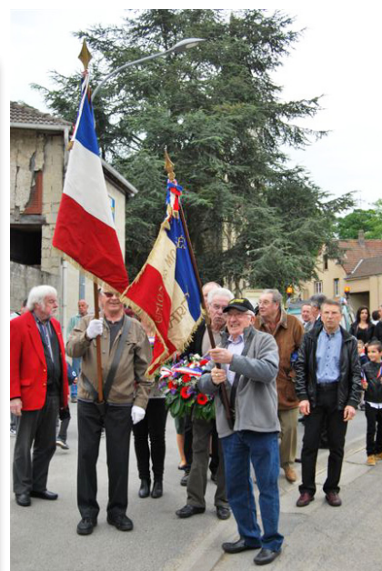
Départ du défilé vers le cimetière.